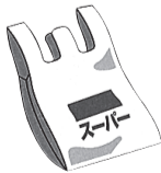
レジ袋は石油の塊

レジ袋は、ポリエチレンやポリプロピレンといったプラスチックでできています。プラスチックは石油からできています。つまり、レジ袋は石油からできています。