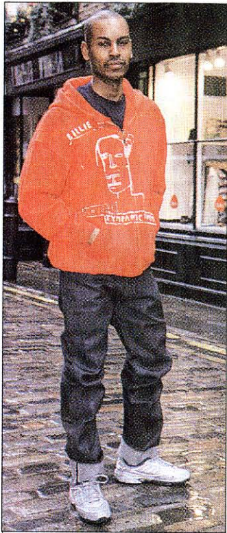
エヴィスジーンズやエドウィンなど日本のジーンズは若者に根強い人気＝ロンドンで